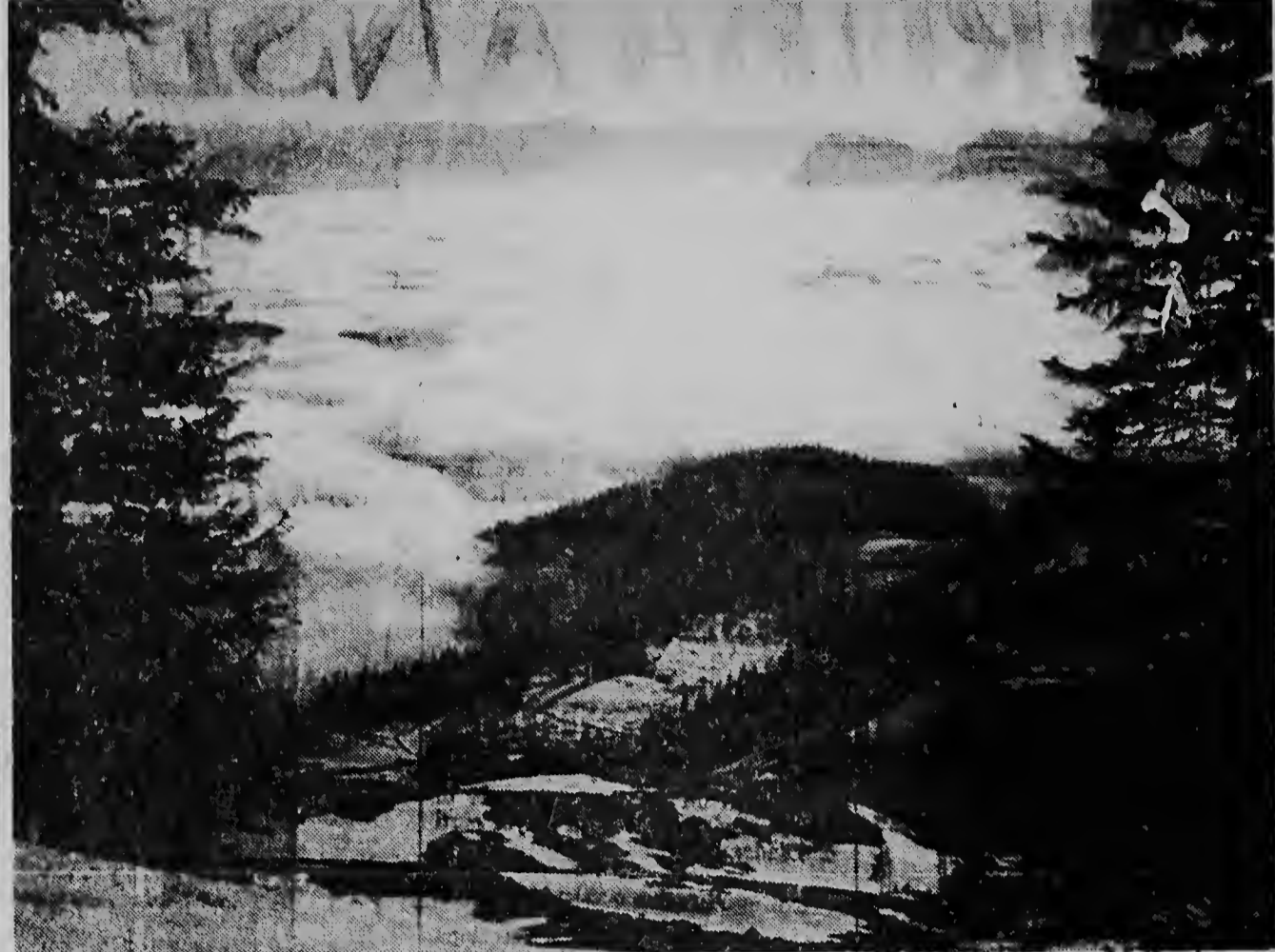
Un foto saca di un altura di mas di 1500 meter. Den e valle di Chiengmau na Beiren tin un scuridad tristu, pa motibo cu un nubia scur y dikl ta pasando riba dje, mientras ariba dje nubia e solo ta kima tranquil y sabroso.